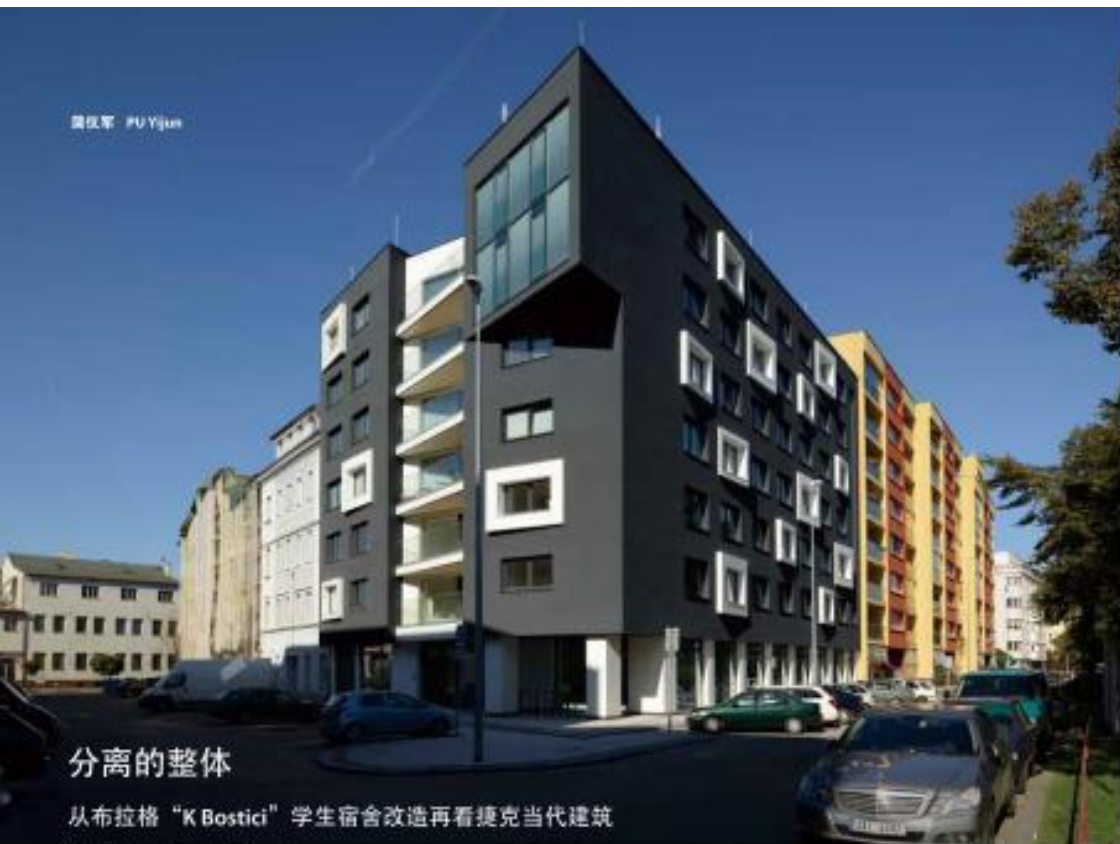
蒲俊军 PU Yujun