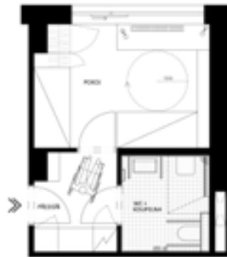
bezbariérový pokoj – 24 m 2