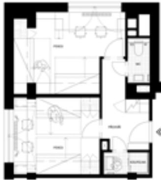
čtyřlůžkový pokoj – 40 m 2