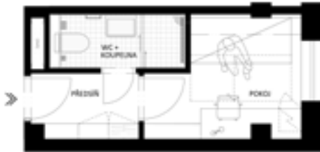
jednolůžkový pokoj – 12 m 2