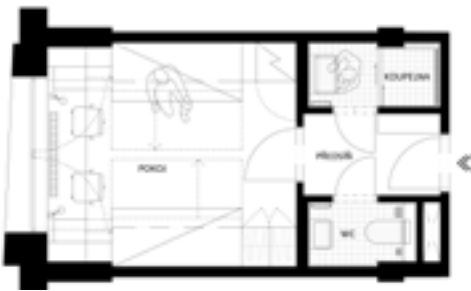
dvoulůžkový pokoj – 20 m 2